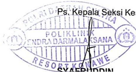
SYAFRUDDIN AIPDA NRP 81040759

Ps. Kepala Seksi Kesehatan Polres Konawe